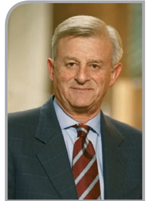
Giuseppe Donato Presidente Centro Estero per l'Internazionalizzazione

Riferimento per le imprese del territorio che operano o intendono operare sui mercati esteri e per gli interlocutori stranieri interessati a conoscere il nostro sistema economico, Ceipiemonte nel 2013 gestisce un programma di attività innovativo, sostanzialmente legato al Piano strategico per l'Internazionalizzazione del Piemonte, varato da Regione e sistema camerale piemontese.