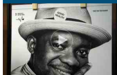
Calendario Lavazza 2018: lo sviluppo sostenibile in 17 ritratti