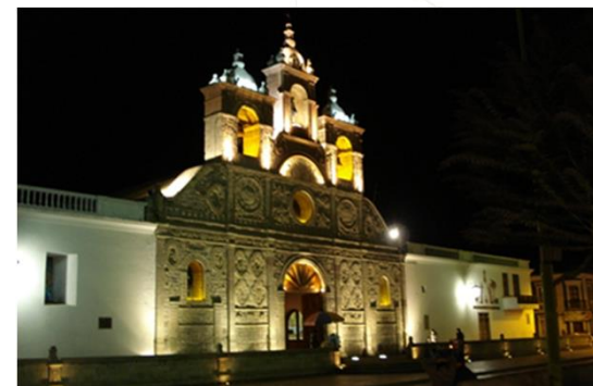
"Catedral de Riobamba"