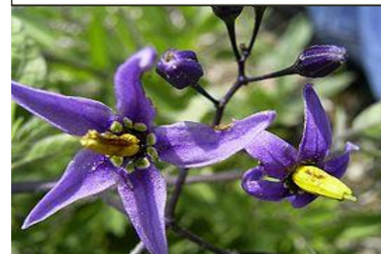
%Dulcamara+pianta utilizzata nella produzione farmaceutica.